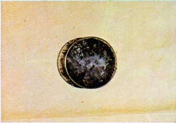
Fig. 2 — Microsporium amazonicum . Crescimento em "isca" de cabelo.

A descrição deste fungo, feita em 1967, teve por base duas culturas obtidas por Moraes et al. (1967), do pêlo de dois ratos silvestres do gênero Oryzomys , capturados perto da cidade de Manaus, Estado do Amazonas. Os aspectos culturais do M. amazonicum e principalmente de seus macroconídios fusiformes, com 1 a 3 septos, numerosos e bem característicos, não deixam dúvida e permitem distinguir esta espécie, com facilidade, das outras do mesmo gênero. Tanto é assim que, logo no ano seguinte, foi ela incluída por Ajello (1968), em uma lista dos dermatófitos conhecidos na época, que o referido autor fez publicar.