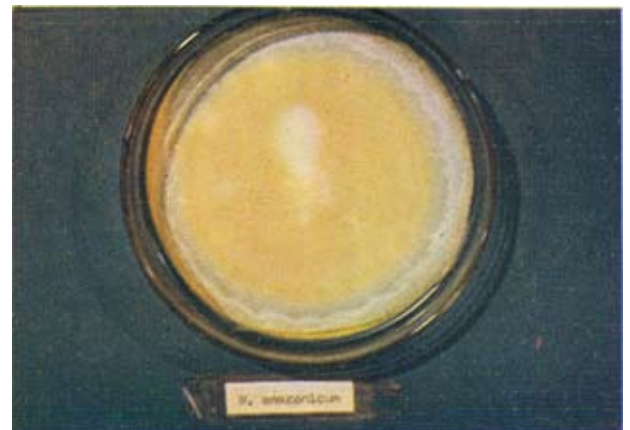
Fig. 4 Microsporium amazonicum em pêlo humano.