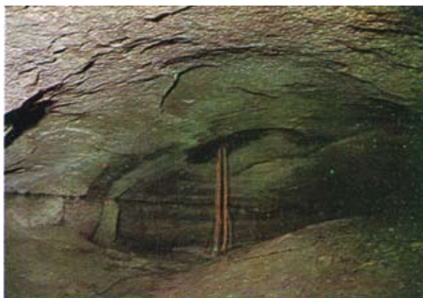
Fig. 1 — Gruta de onde foi coletado o solo.

de 50 metros do leito da estrada. Seu interior consta de dois compartimentos circulares (Fig. 1) com paredes de pedras nas quais existem diversos refúgios ou tocas, utilizados por animais de hábitos noturnos. O local é bastante escuro, tendo exigido o uso de lanternas para o trabalho de coleta. No solo, arenoso e úmido, encontrou-se diversas poças d'água.